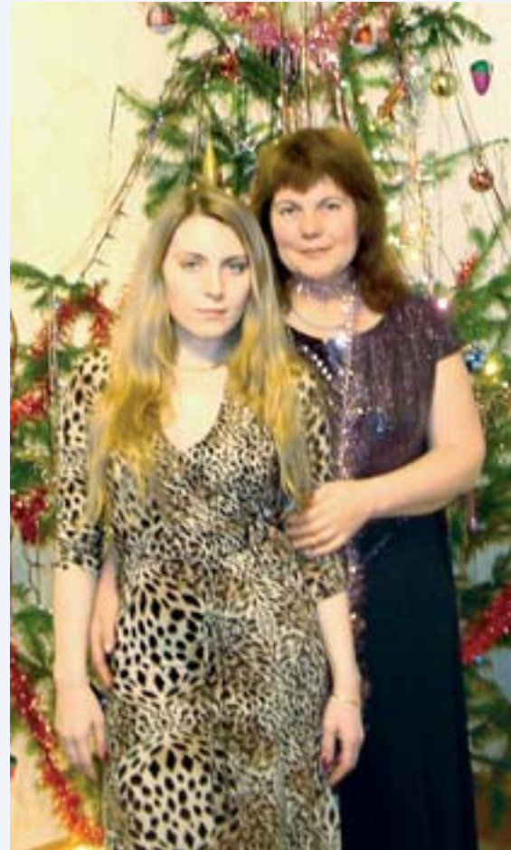
Екатерина Викторовна с дочерью

- Скажу так. Деньги на господдержку сегодня выделяются большие, но до нас, к сожалению, доходят только крохи. ГСМ нам продают подешевле, но зато забрали