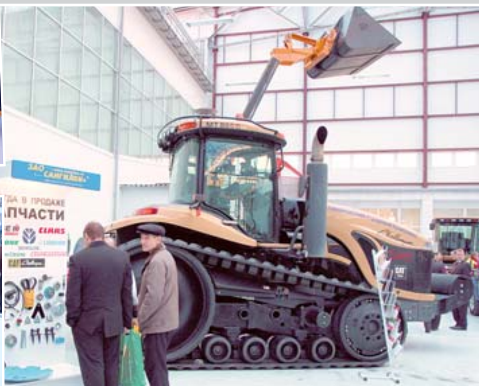
Технику представила компания «САНГИЛЕН+»