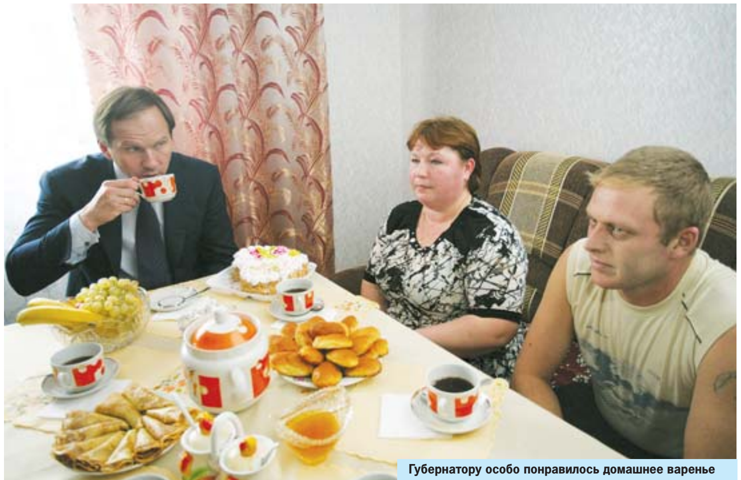
Губернатору особо понравилось домашнее варенье