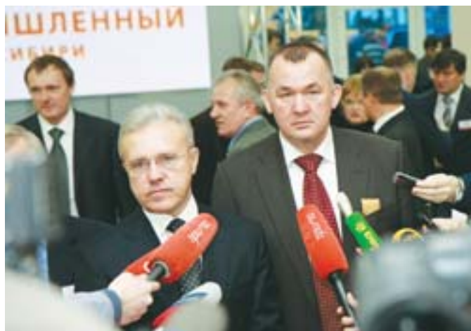
Красноярский край станет регионом-донором для других субъектов

- Это знаковое событие в череде многих, которые проходили в Красноярском крае в рамках Года сельского труженика. Форум-мероприятие, на котором предполагается обсудить, прежде всего, перспективы развития сельскохозяйственной отрасли. Как в крае, так и в России в целом. Здесь уже начали работать различного рода «круглые столы», в которых принимают участие специалисты сельского хозяйства, сами труженики, руководители территорий. Важнейшей частью обсуждений и дискуссий будет подписание договоров между краевыми сельхозпроизводителями и нашими гостями. А традиция проведения таких форумов