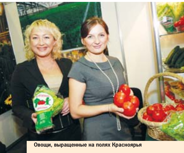
Овощи, выращенные на полях Красноярья

Второй день работы форума был назван «деловым». С утра практически во всех павильонах открылись «круглые столы» и дискуссионные клубы на различные тематики. Каждый сельхозпроизводитель мог выбрать тему, которая ему интересна. Консультантами на мероприятиях работали пред-