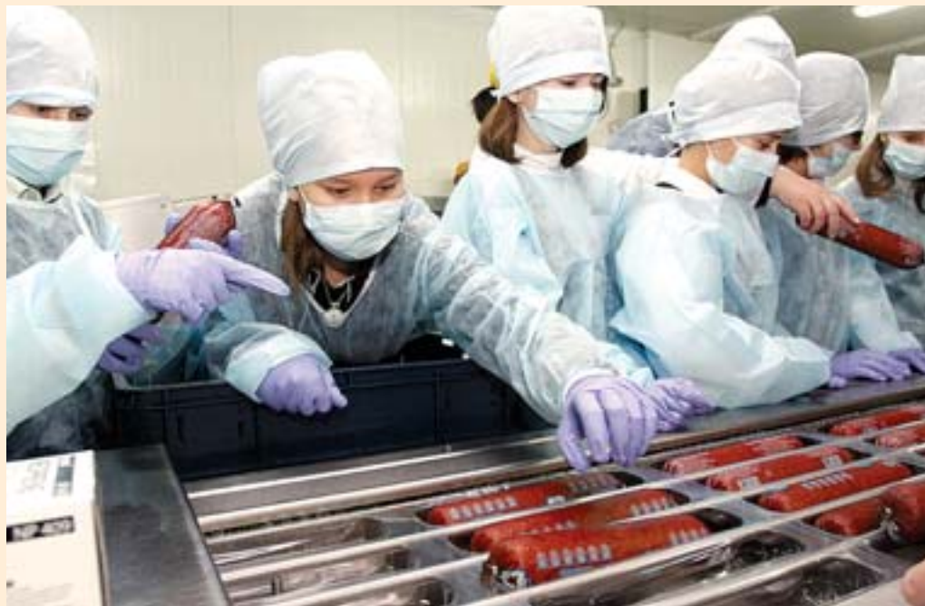
Дети старательно укладывают колбасу в упаковку

Девочки, как наиболее практичные даже в таком возрасте, стали внимательно разглядывать металлические резервуары для свежего фарша.