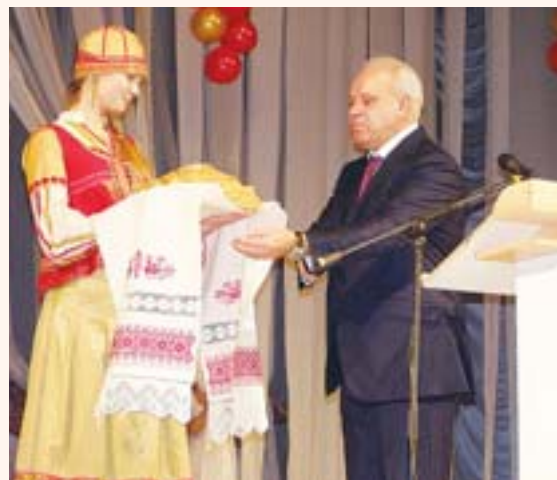
Главе Хакасии Виктору Зиминому преподнесли каравай из муки нового урожая

Виктор Зимин не скрывает, что он покровительствует сельчанам, но и спрашивает строго за вложенные средства в развитие агропромышленного комплекса. И считает: останавливаться на достигнутом при взятом темпе – нерационально. Только вперед – за еще большими результатами.