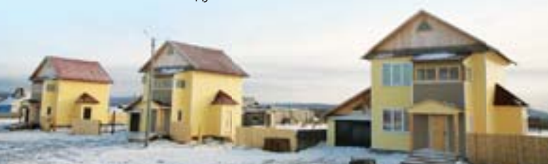
Современные дома для работников ЗАО «Подсосенское»