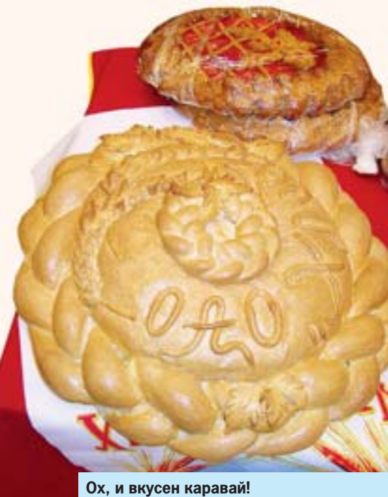
Ох, и вкусен каравай!

Хочу отметить, что начали переработку молока на абаканском предприятии СПК