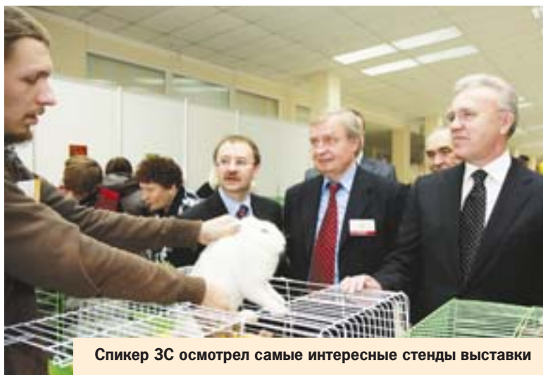
Спикер ЗС осмотрел самые интересные стенды выставки

лет, а урожайность седьмой год подряд является наивысшей среди регионов Сибирского федерального округа. Благодаря господдержке, модернизации производства, внедрению инноваций успешно развиваются и другие отрасли краевого АПК. Красноярский край занимает 4-е место по валовому производству молока в СФО и 2-е по молочной продуктивности. Мы держим 3-е место по объему производства свинины по всем хозяйствам, а также успешно развиваем отрасль птицеводства. Научившись производить качественную продукцию, мы сделали следующий шаг - к решению сбытовой проблемы. Для этого в крае запущены проекты организации магазинов «шаговой доступности» и прямых продаж бочкового молока. В рамках закона о дополнительных мерах господдержки АПК торго-