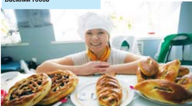
В холле Дома культуры в Степном можно было купить пироги и булочки местного производства: вкусные и дешевые