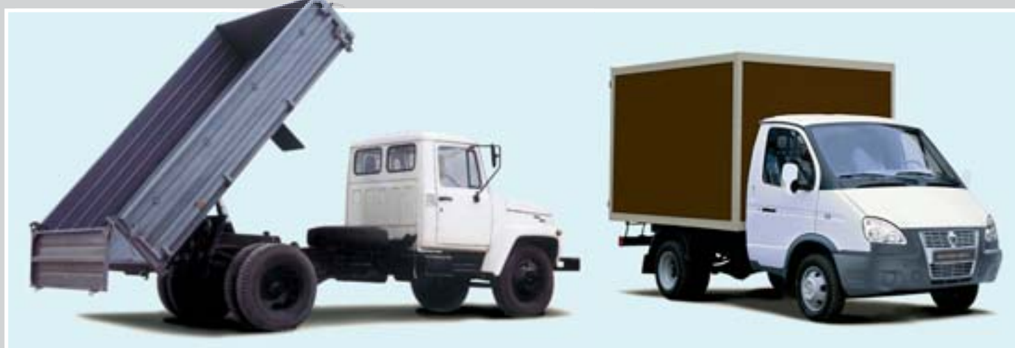
Технику представила компания «КрасГазСервис»