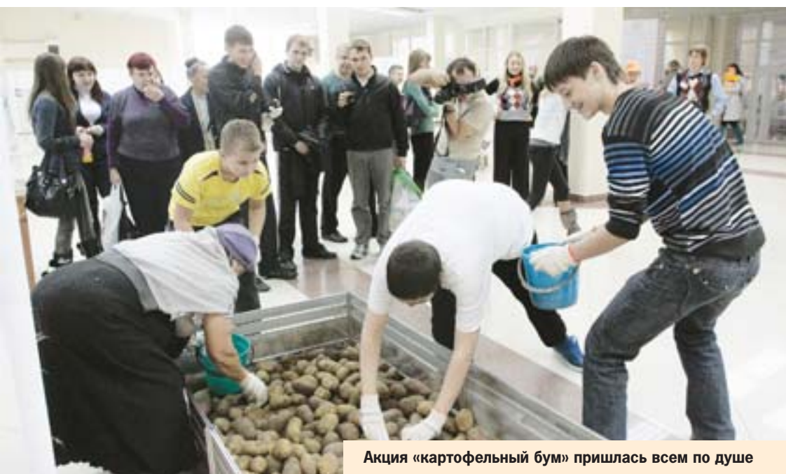
Акция «картофельный бум» пришлась всем по душе