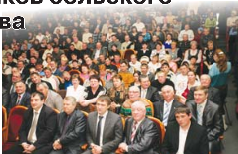
Во время торжественной церемонии в зале не было свободных мест