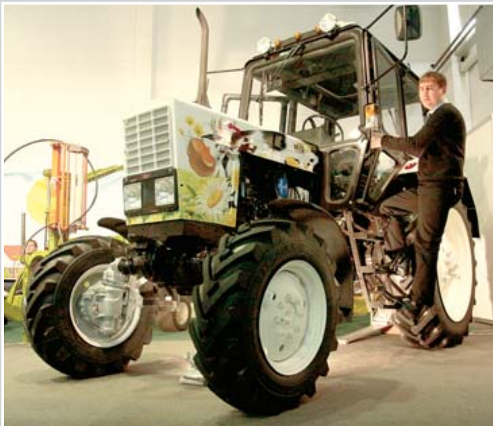
Технику представила компания «АСМ Красноярск»