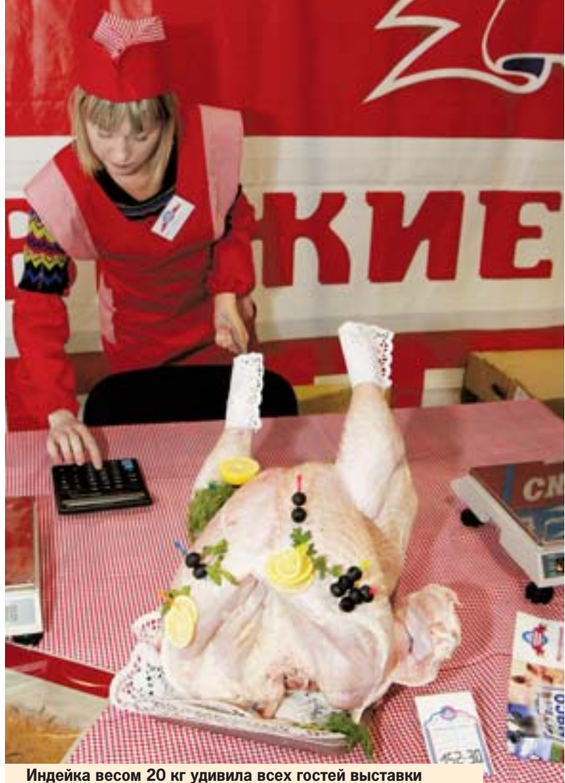
Индейка весом 20 кг удивила всех гостей выставки

- Выставка достижений АПК давно зарекомендо-