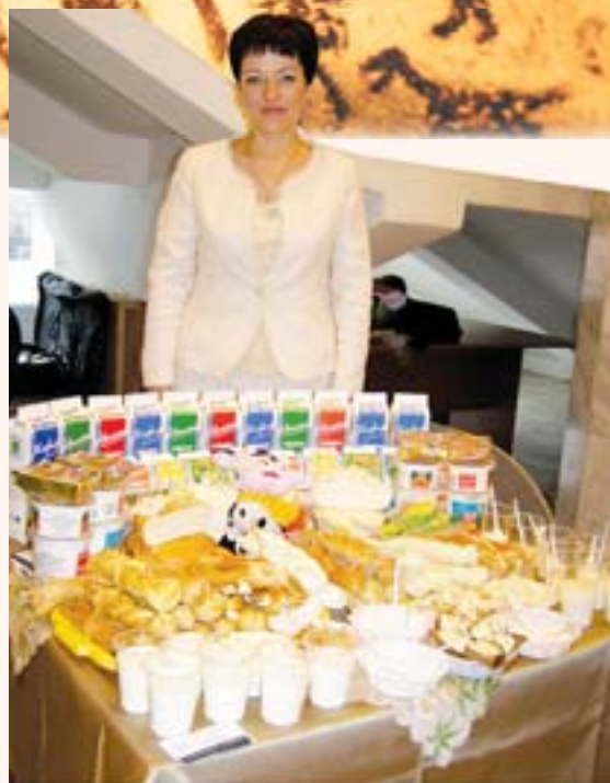
В Хакасии предлагают натуральное молоко и молочную продукцию

В рамках долгосрочной целевой программы «Развитие агропромышленного комплекса Республики Хакасия и социальной сферы на селе на 2010 – 2012 годы» на эти цели предусмотрено почти 47 миллионов рублей. За десять с половиной месяцев текущего года в результате государственной поддержки из бюджетов всех уровней свои жилищные условия смогли улучшить 85 участников программы. На рассмотрении администраций муниципальных районов находится еще 15 пакетов документов, что предусматривает 100-процентное освоение средств федерального, республиканского и местного бюджетов по данной программе. На следующий год планируется улучшить жилищные условия для 186 участников из 8 муниципаль-