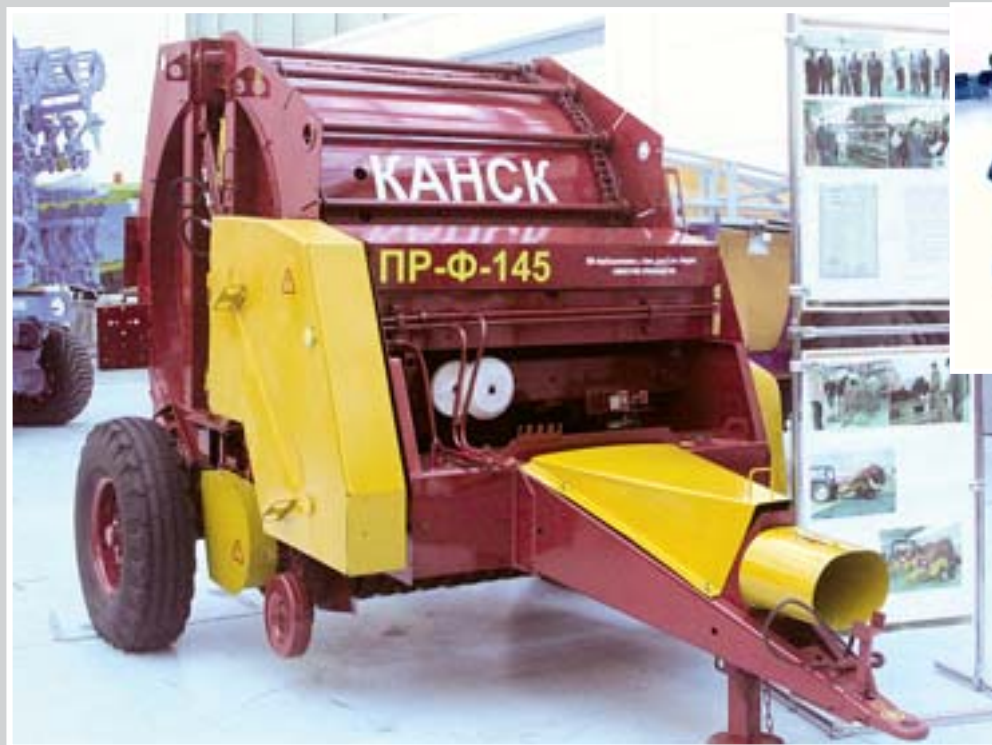
Технику представила компания «АгроСельхозтехника»